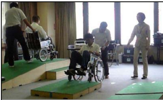
サービス介助士講習