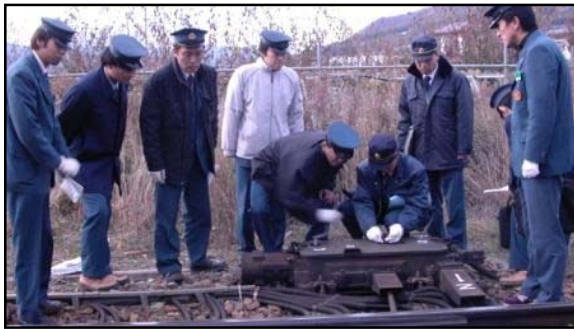
転てつ器取扱訓練